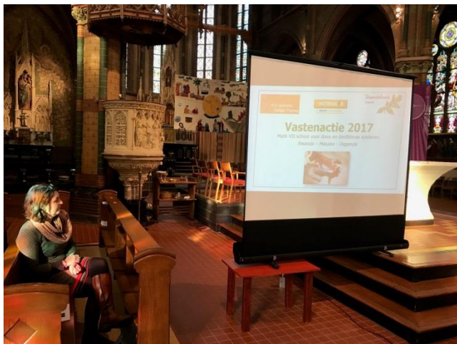
-Presentatie Vastenactieprojecten in de Bonifatiuskerk, Alphen a/d Rijn