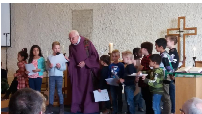
-Tijdens de viering in de Bron krijgen Kinderen kleurplaten over gebarentaal, en Krijgen uitleg over doofblindheid. Daarna vertellen zij hun ervaringen met de ouderen.