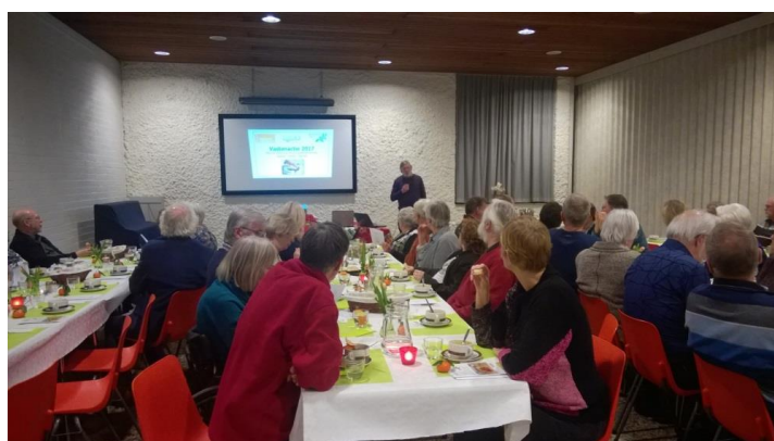
-Presentatie tijdens de eerste sobere maaltijd in de Bron