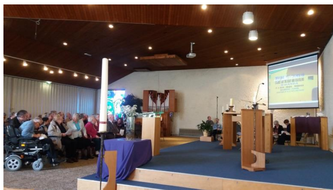
-Presentatie Vastenactieprojecten in de in de Bron, Alphen a/d Rijn