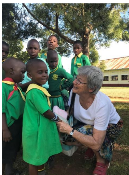
Riet in contact met de kinderen van de St. Mark School