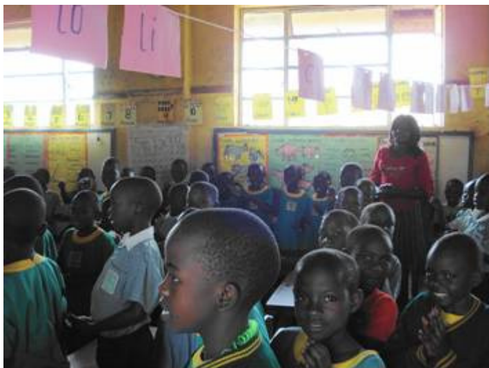
Groep 3 van de basisschool st Theresia