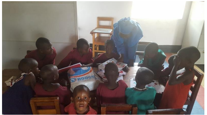
Op deze foto's is te zien hoe de voelboekjes worden uitgedeeld aan de kinderen van de St. Mark school. De voelboekjes zijn gemaakt door kinderen uit de onderbouw van de Tweeklank. Bekijk ook het filmpje hiervan op onze facebooksite: https://www.facebook.com/Vastenactie-2017-help-de-St-Mark-School-Bwanda-856049381161827/?ref=bookmarks